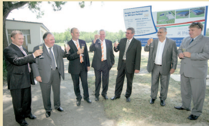
Pezsgős koccintás az ünnepélyes alapkövetélen

PROFIK AJÁNLJÁK PROFIKNAK - mint ahogyan az OBO jelszava is tükrözi, a cég termékeit és ötletes szerelési megoldásait profi szakembereknek ajánlja, a villanszerelőktől a szakipari kivitelezőkig, akár a nagyipari projektekhez is.